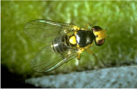
三叶草斑潜蝇