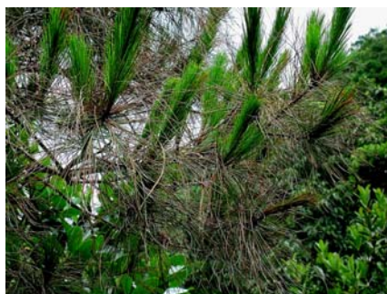
松突圆蚧危害状