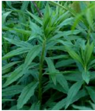
加拿大一枝黄花（陈彬 摄） 加拿大一枝黄花（陈彬 摄）