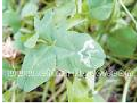
三叶草斑潜蝇危害状（自百度网）