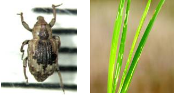
稻水象甲成虫（张润志 摄） 稻水象成虫危害状（张润志 摄）