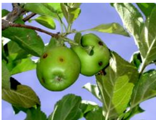
苹果蠹蛾危害状