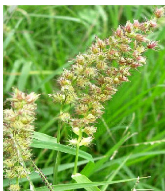
蒺藜草（中国自然标本馆 供） 蒺藜草（中国自然标本馆 供）