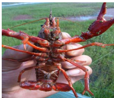
克氏原螯虾饲养地