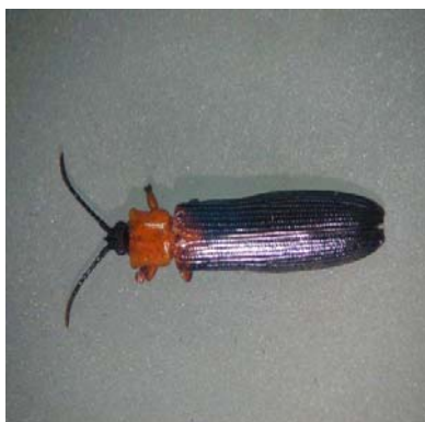
椰心叶甲（自互动百科网）