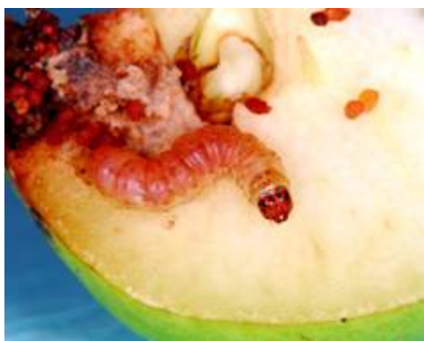
苹果蠹蛾幼虫