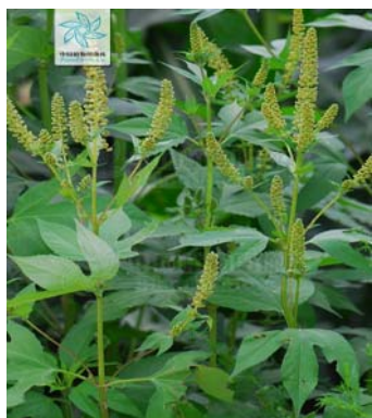
三裂叶豚草（李敏 供）