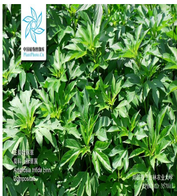
三裂叶豚草