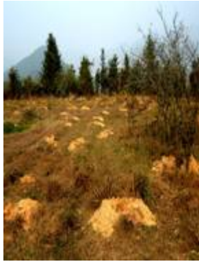
红火蚁蚁巢